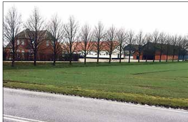
Gården, Døllerup Nørgaard, på adressen Koldingvej 41 i Lunderskov - her fotograferet fra Rute 32

Svinefarmen ligger på Koldingvej 41 lige i udkanten af Lunderskov by. Der er kun en landevej, (Rute 32), plus et ret smalt beplantningsbælte fra matriklen, hvor farmen ligger til boligområdet ved Højvang i Lunderskov Nord.