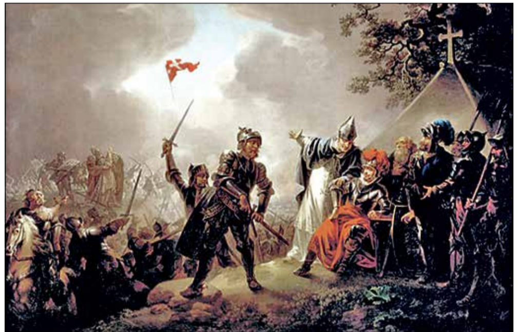
Det danske flag stammer fra korsriddernes kamp i Estland.

- Hver gang loge brødrene mødes gives et mindre beløb, som - når det er stort nok - gi- ves anonymt til et velgørende formål. Vi har givet donationer til sygehuse og organisationer, hvor vi kan hjælpe børn og unge.