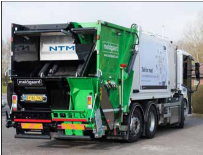
Her ses en af de nye skraldebiler, der skal hente affald i Lunderskov og Vamdrup.