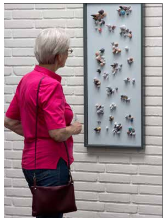
Billederne blev nydt og studeret nøje.