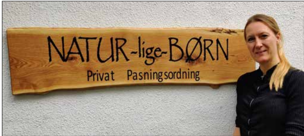
Lisbeth Lindholms pasningsordning skifter navn.

Lisbeth mener, at naturen altid byder os velkommen med frisk luft, spændende oplevelser og liv. Hun siger, at der altid er masser af plads til at