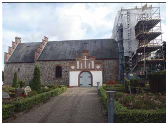
Den smukke Hjarup Kirke set fra nord.