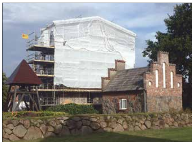
Kirkens klokkestabel, den under renoveringen tildækkede vestlige gavl, og det lille kapel set fra vest.