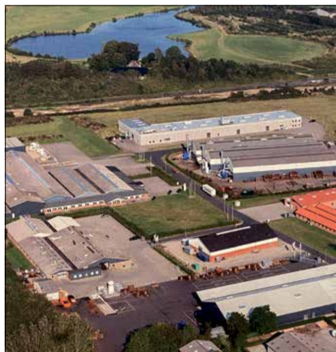
Lufffoto af BSB Industry.