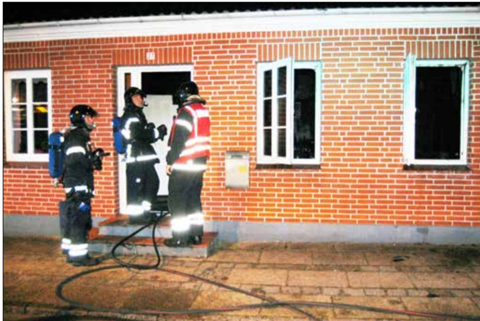
Her er brandvæsnet i gang med at slukke branden på Nørregade 27.